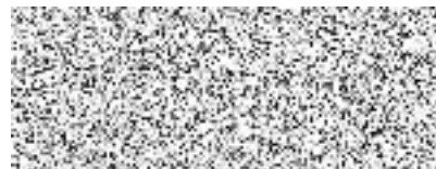
Petr Střelka starosta obce Ludvíkovice